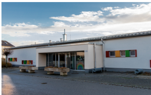
Das Haus für Kinder erstrahlt in neuem Glanz.

Nachdem am Außenputz am Haus für Kinder einige Risse zum Vorschein kamen, wurde die gesamte Fassade in Augenschein genommen und schadhafte Stellen ausgebessert. Danach erhielt das Gebäude einen neuen Anstrich. Dabei verzichtete man (auch auf Anraten des Malerunternehmers) auf die leuchtend rote Farbe. Der Eingang erstrahlt nun in einem dezenten Beige.