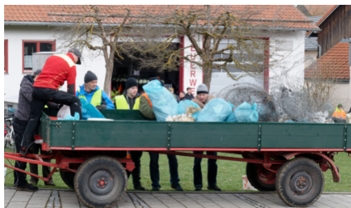
Fleißige Helfer beim „Rama-Dama“

von 2 – 85 Jahren waren am Werk, um in und um Böhmfeld herum wieder allerlei Müll und Unrat zu sammeln. Ein herzlicher Dank an alle Mitwirkenden!