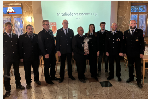
Der neu gewählte Vorstand des Feuerwehrvereins