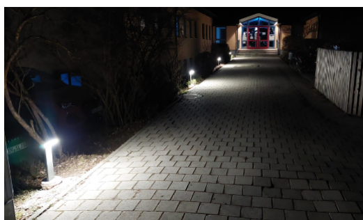
Die neuen Lampen am Eingangsbereich

Anfang des Jahres 2023 standen erste Um- rüstarbeiten für die LED-Beleuchtung im ge- samten Schulgebäude und der Turnhalle auf dem Plan.