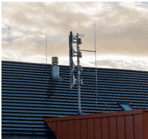
Die neue Sirene am Gemeinschaftshaus

Eine neue Sirene konnte bereits im Frühjahr auf dem Wertstoffhof errichtet werden, die zweite Sirene steht seit November auf dem Gemeinschaftshaus. Die beiden Sirenen sind so ausgelegt, dass das gesamte Gemeindegebiet beschallt werden kann.