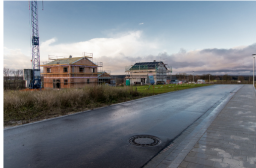
Die ersten Rohbauten stehen.

Die Pumpstation am Baugebiet ging im November in Betrieb und die Straßenbauarbeiten im Baugebiet sind soweit abgeschlossen. Mittlerweile stehen auch die ersten Rohbauten. Von den 14 gemeindlichen Bauplätzen wurden insgesamt fünf zurückgegeben.