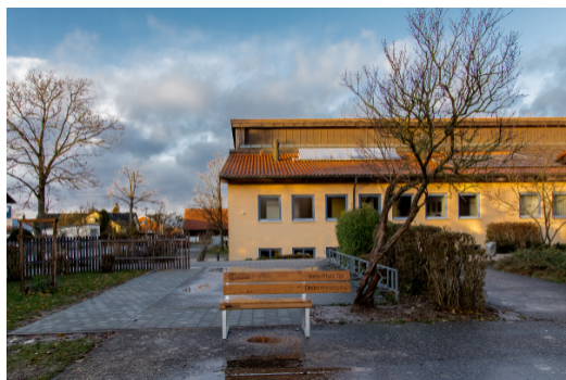
Der vergrößerte Radl-Parkplatz an der Schule

Begonnen wurde im Eingangsbereich der Schule und der Turnhalle. Aufgrund der steigenden Stromkosten (s. auch Bericht auf Seite 15) war dies mit Sicherheit ein wichtiger Schritt. Auch auf dem Weg zum Schulgebäude wurden LED-Außenleuchten angebracht.