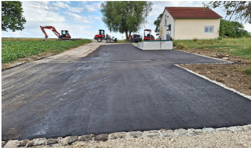
Neuer Asphalt zum Bauhof

sammenhang weisen wir noch einmal darauf hin, dass ab März die Grüngutstelle wieder an zwei Tagen geöffnet sein wird. Die Öffnungszeiten am Mittwoch und Samstag Nachmittag werden so beibehalten.