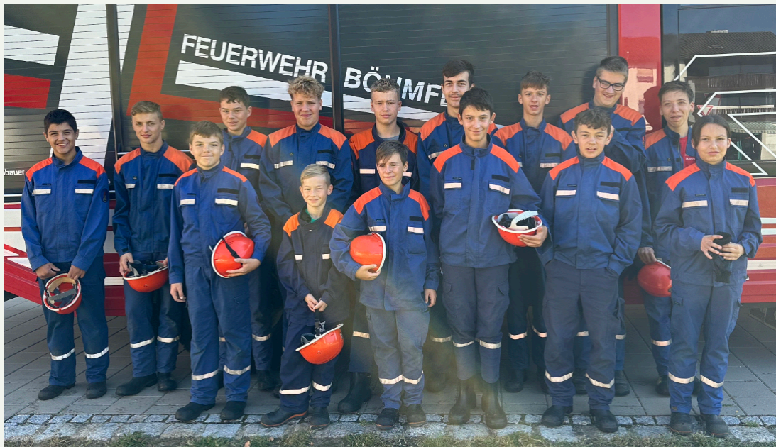
Der Nachwuchs unserer Böhmfelder Feuerwehr nach der erfolgreichen Teilnahme am Jugendaktionstag Bericht und Fotos: Stefan Stadler