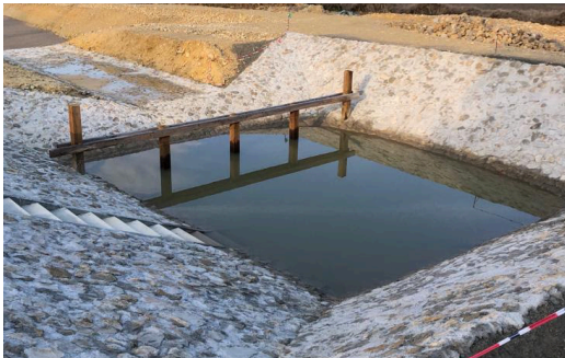
Das neue Sickerbecken zwischen Böhmfeld und Hofstetten

Im Zuge der Erschließungsarbeiten des Baugebietes im Lehen wurde das Sickerbecken westlich von Böhmfeld errichtet.