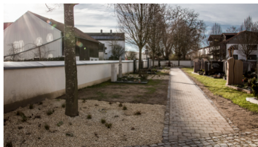
Die neu gestalteten Blumenbeete im Friedhof

Die Arbeiten am Friedhof sind seit Frühjah- r 2023 abgeschlossen. Es entstanden neue Urnengräber und Baumurnengräber. Die Anpflanzungen am Eingangsbereich und entlang des Weges an der Bonifatiusstraße sind gut angewachsen. Auch heuer zielt wieder ein Christbaum unseren Friedhof. Dafür gilt ein herzlicher Dank an unsere Bauhofmitarbeiter für das Aufstellen und Schmücken.