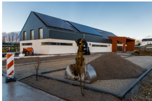
Die Außenarbeiten sind größtenteils abgeschlossen.

Auch der Bau des Gemeinschaftshauses verlief gut im Zeitplan. Mittlerweile ist das Gebäude im Betrieb – eine offizielle Einweihungsfeier ist für Frühjahr 2024 geplant.