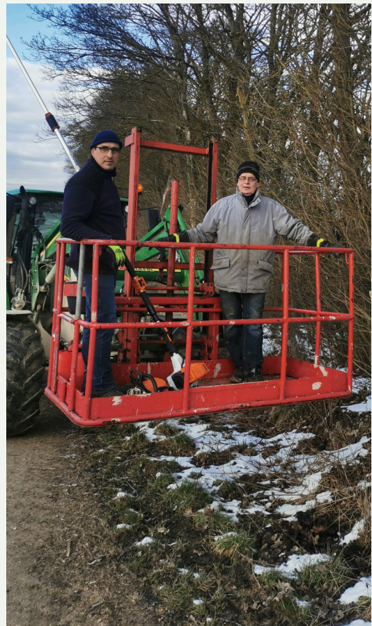
Die Jagdgenossen beim Einsatz: Wegebau „Im Striegl“ und Heckenschneiden