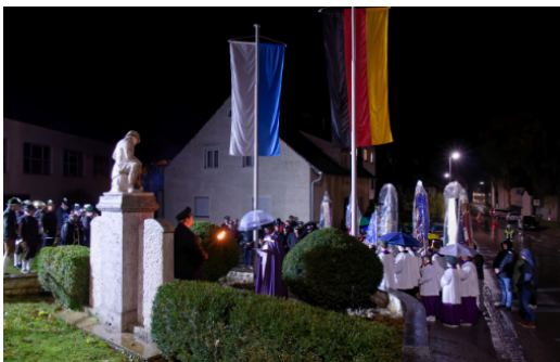
Gedenkfeier am Kriegerdenkmal