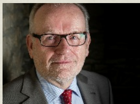
Alfred Ostermeier 1. Bürgermeister

Wir freuen uns auf ein Wiedersehen bzw. Kennenlernen im Kotterhof - Hofstetter Straße 3 - 85113 Böhmfeld.