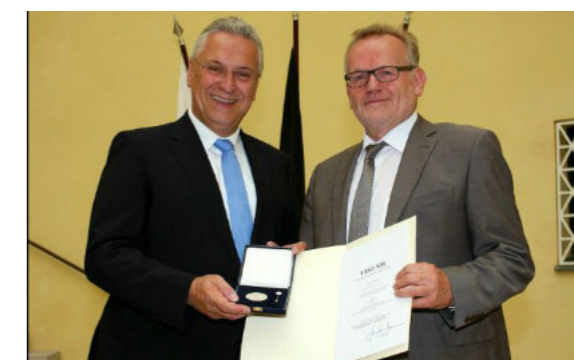
Auszeichnung durch Staatsminister Joachim Hermann am 28.7.2014