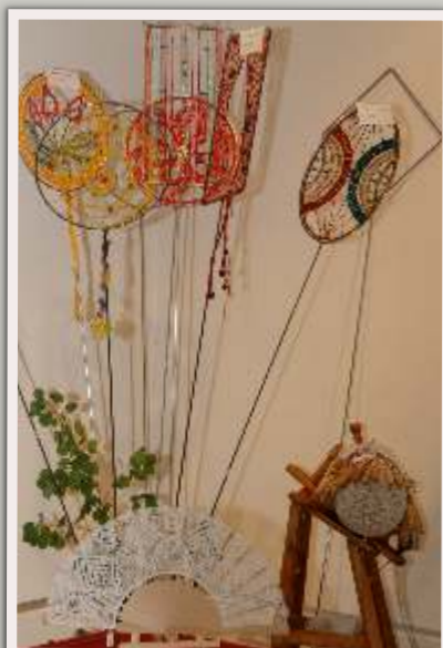
Klöppelausstellung 16./17. Juni