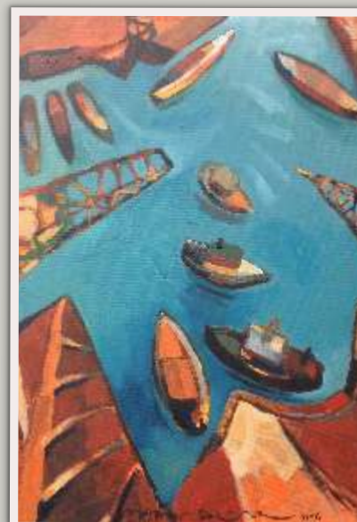
Ausstellung "Mare" 8.-15. April

Samstag, 11.00-17.00 Uhr Sonntag, 10.30-17.00 Uhr